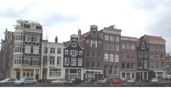
Birinci INSTEM Konferansı, Amsterdam

Birinci INSTEM konferansı 19-20 Mart 2013 tarihinde Amsterdam'da düzenlenmiştir. Konferans, proje koordinatörü olan Almanya'daki Freiburg Üniversitesi tarafından organize edilmiştir. Konferans gündemi, Innsbruck'taki ilk konsorsiyum toplantısı sırasında oluşturulmuştur. Ayrıca iş paketi liderlerini kapsayan bir Skype toplantısı da 25 Şubat 2013 tarihinde koordinatör tarafından aynı amaçla organize edilmiştir.